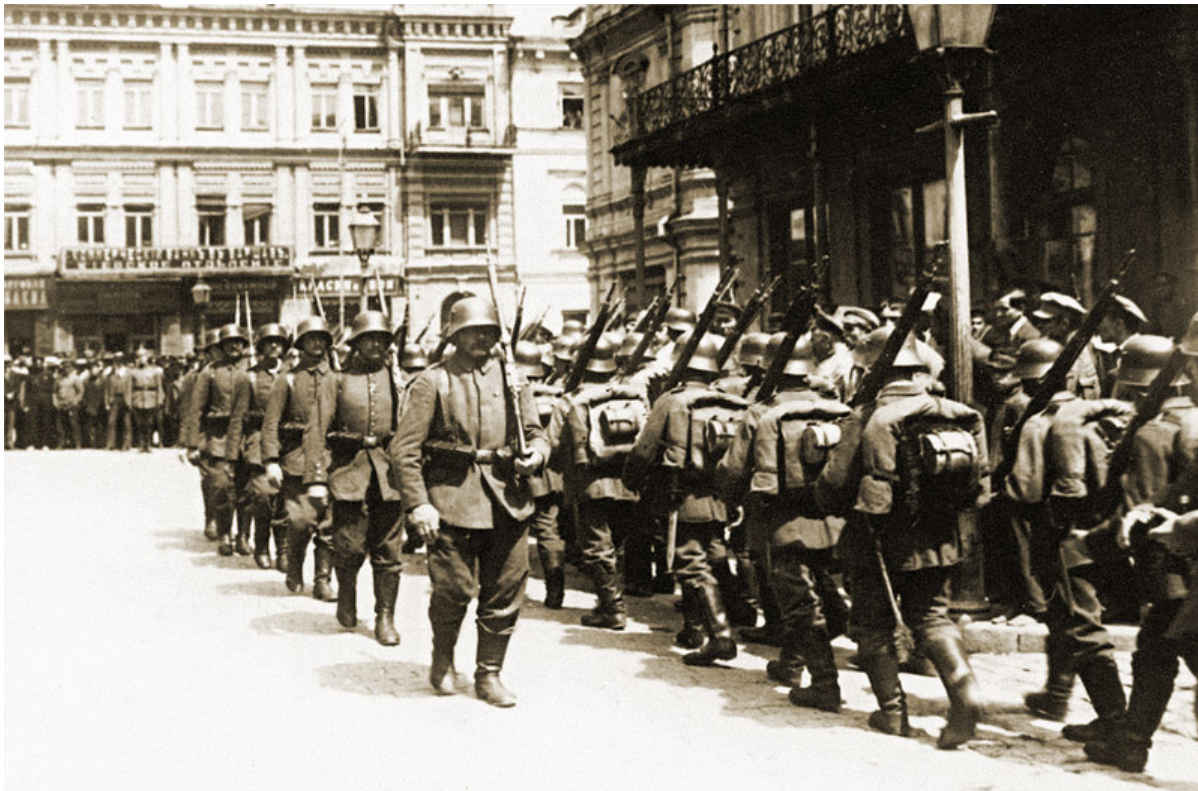
Смена немецкого караула на Думской площади, 1918

— Интересно, что первые погромы — весной 1918 года — как раз на совести отступающих под натиском войск Центральной Рады и Центральных держав большевиков. Пронеслись они в основном по Черниговской губернии.