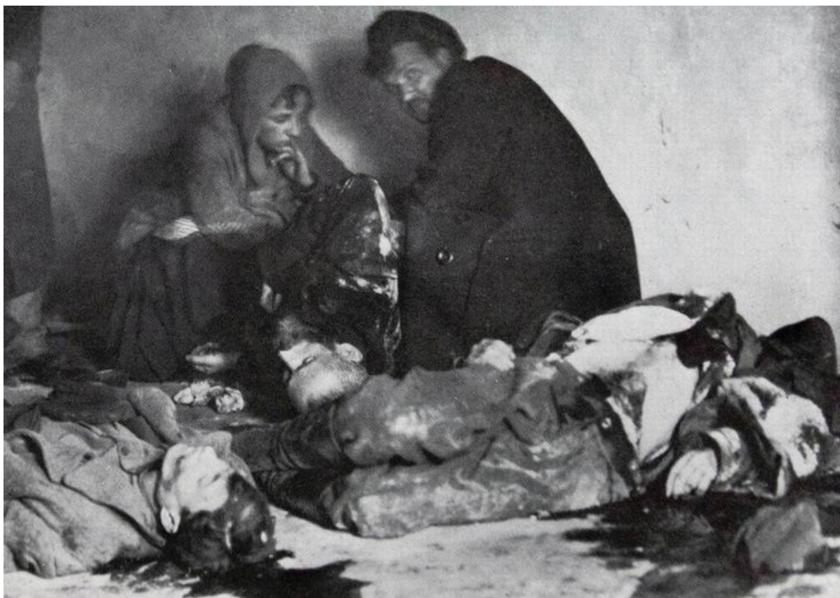
Опознание тела убитого в погроме родственника, апрель 1919

— Разумеется, никаких распоряжений сверху об организованном насилии не было. На процессе Шварцбарда некоторые свидетели утверждали, что якобы видели телеграмму из центра с предписанием устроить еврейский погром, но телеграмма эта сгорела и т.п. Все это звучит более чем сомнительно — никто никогда не видел погромных приказов от руководства УНР.