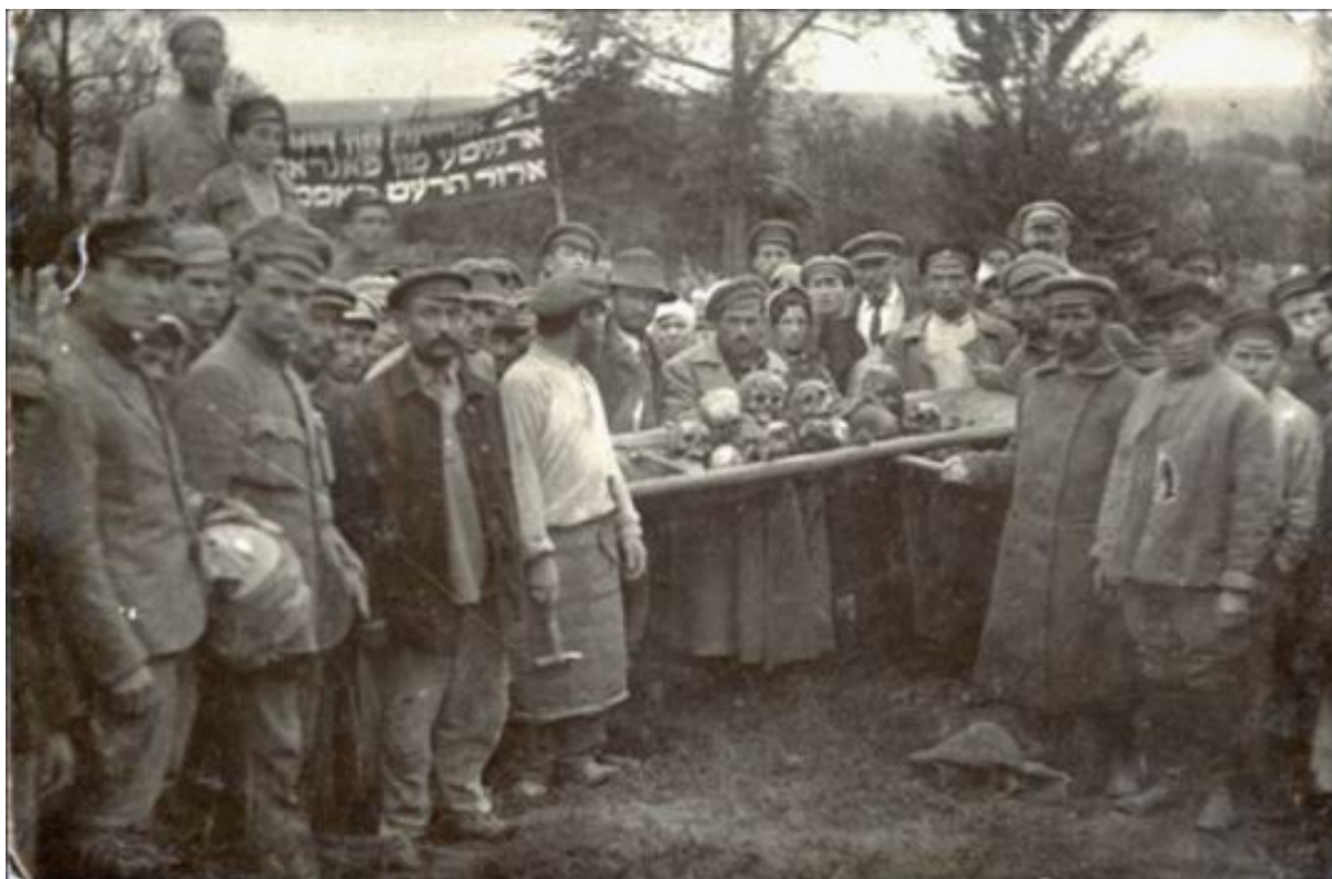
Погребение останков жертв деникинского погрома в Фастове, сентябрь 1919

том, что это антиукраинская и антикрестьянская власть.