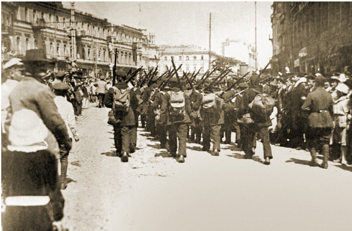
Польские и украинские войска на Крещатике, май 1920

Собственно, и у большевиков поначалу не было понимания важности антипогромных мер — их подтолкнули к этому еврейские социалисты. До этого красные тоже ограничивались малозначащими декларациями.