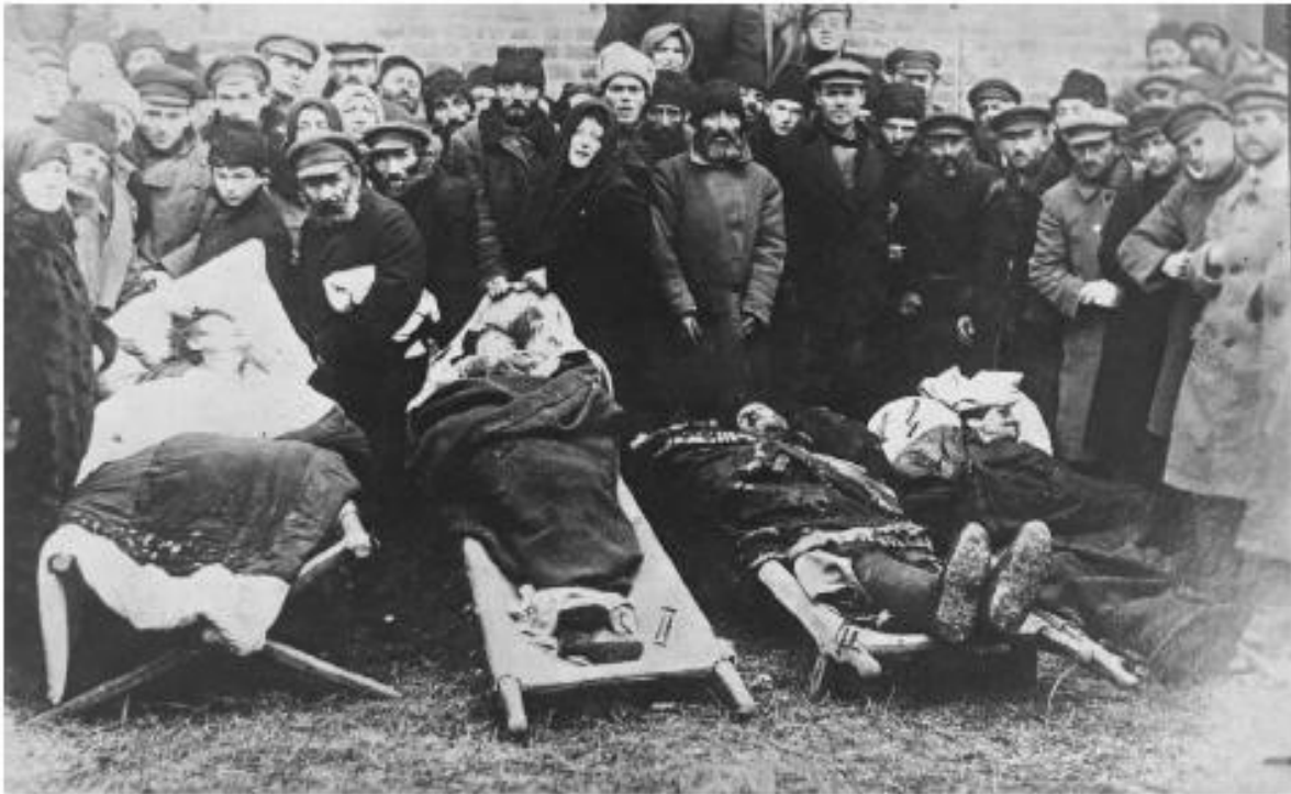
Жертвы погрома в Проскурове, февраль 1919

справедливость — Красная армия (где в первой половине 1919 года основная масса солдат украиноязычна) растет как на дрожжах за счет вчерашних бойцов УНР.