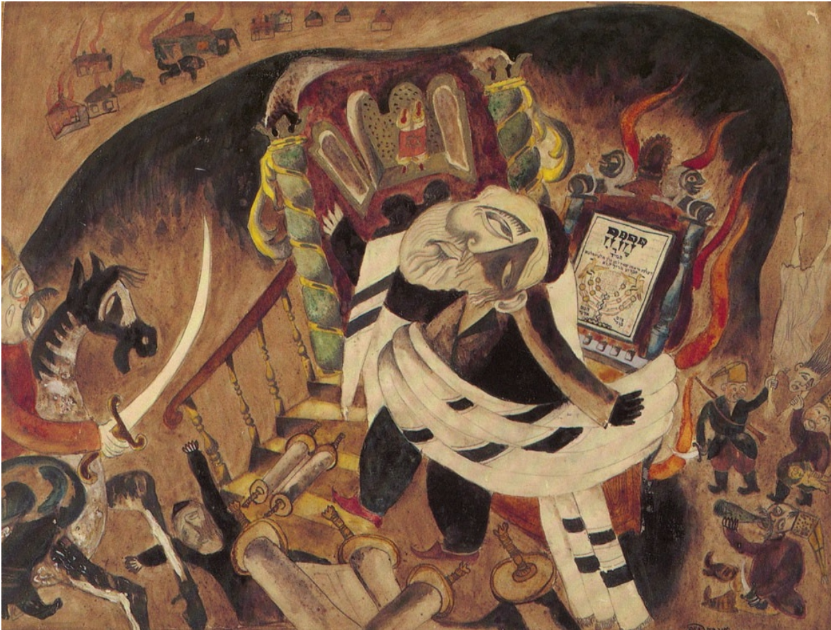
«Погром в Киеве», худ. И. Рыбак, 1919