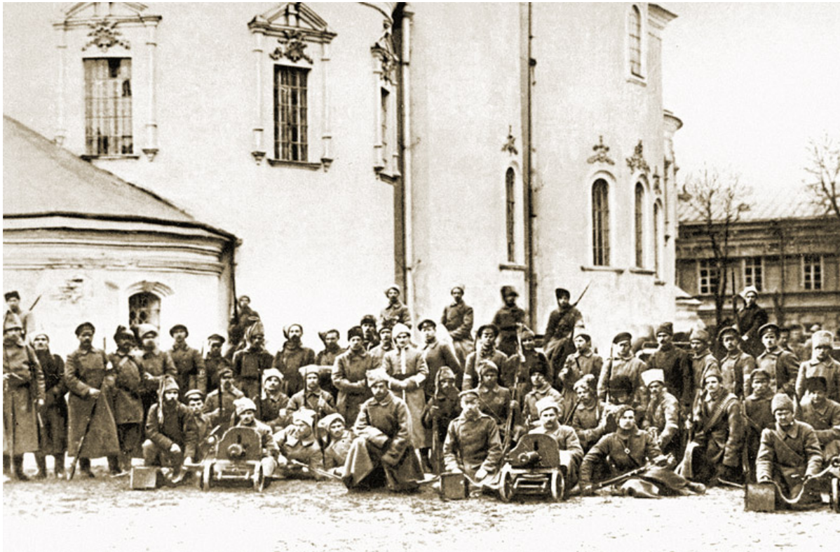
Петлюра среди старшин Гайдамацкого полка армии УНР

— Известно, что многие еврейские партии были против создания отрядов самообороны. В то время как Петлюра поддерживал создание таких формирований. Чем объяснить этот парадокс?