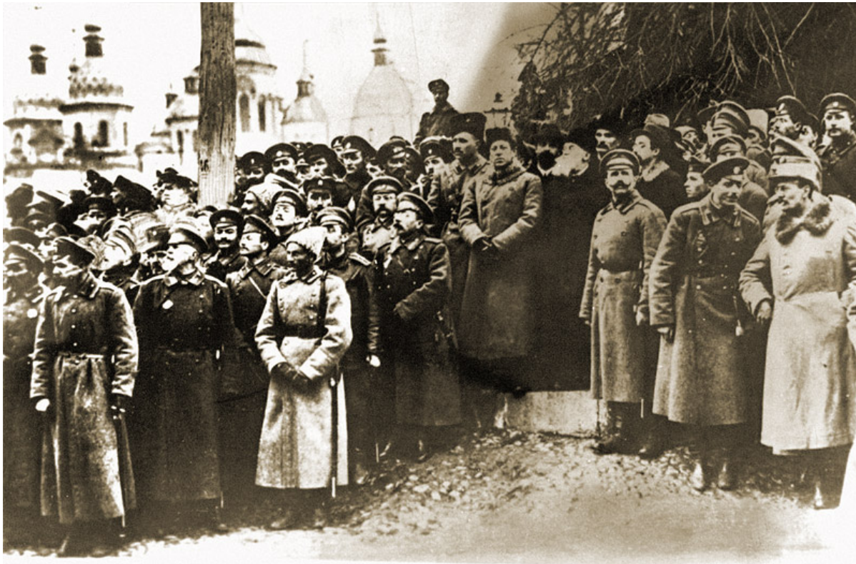
Митинг на Софийской площади в Киеве, октябрь 1917. В центре — Симон Петлюра, Владимир Винниченко, Михаил Грушевский

В этом контексте перед еврейскими партиями встает вопрос, насколько легитимно украинское движение и стоит ли в нем участвовать. Но в течение 1917 года роль Центральной Рады возрастает, что подталкивает еврейские партии к более активному сотрудничеству с ней, да и сама Рада становится политическим органом, выйдя за рамки украинского культурного представительства.