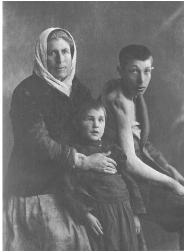
Раненные в погроме