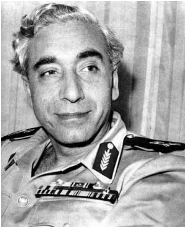
Амин аль-Хафез в бытность президентом

В последние годы активно циркулировали слухи, что между Израилем и режимом Асада при посредничестве России идут переговоры о возвращении тела Эли Коэна. В одном сообщении даже утверждалось, что российские военные обнаружили и вывезли из Сирии останки легендарного разведчика, правда, российский МИД официально опроверг эту информацию. Надо сказать, что ряд сирийских источников настаивает, что на месте захоронения давно возведены жилые комплексы, поэтому искать там нечего.