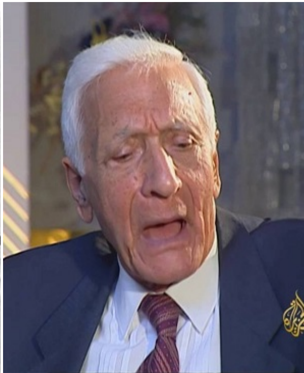
...и в последние годы жизни

На этом фоне сенсацией стало громкое заявление проживающего в Окленде