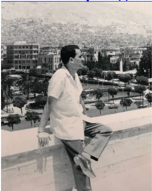
Эли Коэн в Сирии