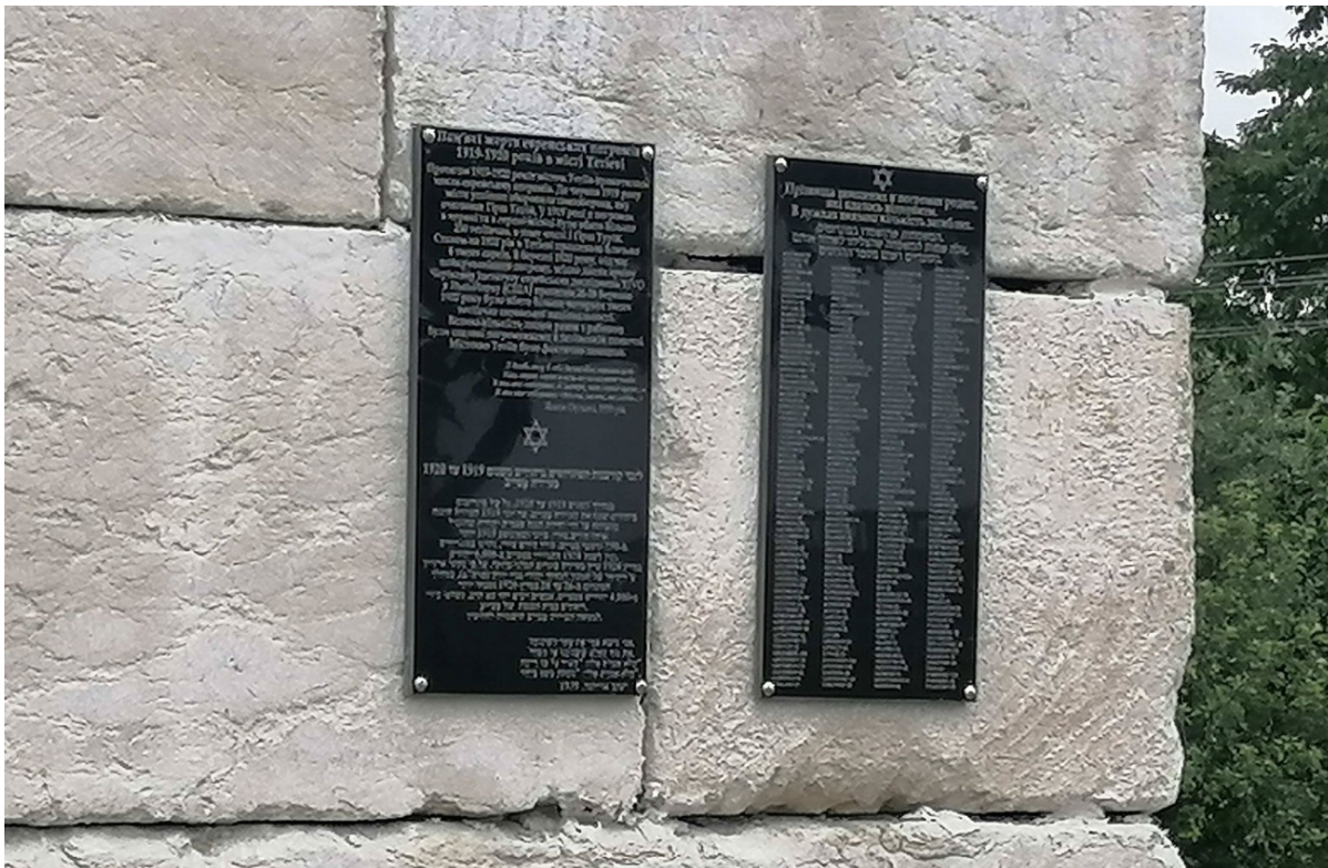
Установленные имена земляков, погибших в еврейских погромах

Впрочем, погром, положивший конец еврейской общине города, «своей» историей считают в Тетиеве далеко не все. Так в одной из групп в FB некоторые обеспокоенные горожане высказывают опасения, мол, не превратится ли Тетиев в Умань (спешим их успокоить — не превратится); другие интересуются, на чьи деньги увековечили память земляков (ни копейки из городского бюджета на монумент не истрчено); имеются ли все необходимые разрешения (мемориал, напомним, открыт на еврейском кладбище).