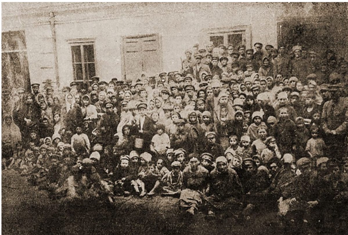
Еврейские беженцы из Тетиева во дворе отдела соцобеспечения, Одесса