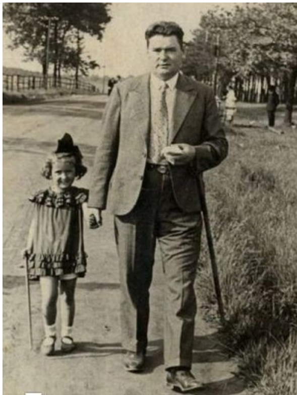
Хенрик с дочерью Кристиной, 1935

его поручению и Циммерман. Всего было сфабриковано около 14 000 подобных документов. Энергичному Цви удалось в конце войны добраться до Палестины, где он занялся политической деятельностью, в 1959 году впервые был избран в Кнессет (всего он провел в парламенте четыре каденции), затем служил послом Израиля в Новой Зеландии.