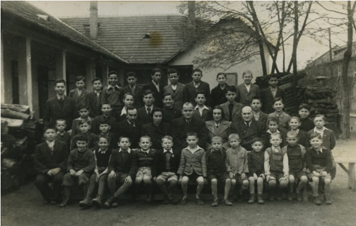
Спасенные праведником еврейские дети в «Школе для детей польских офицеров»