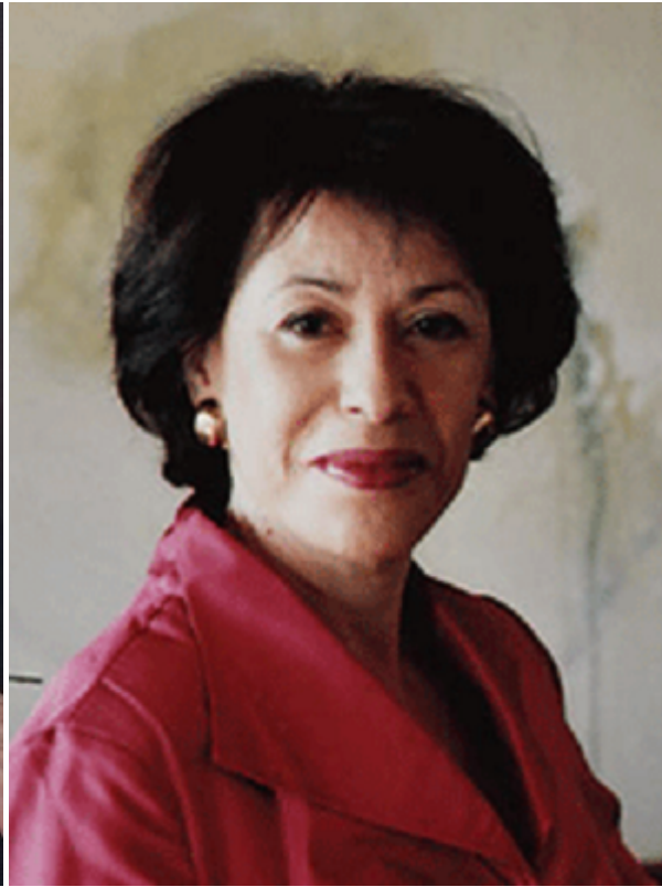
Профессор Стивен Гринблатт