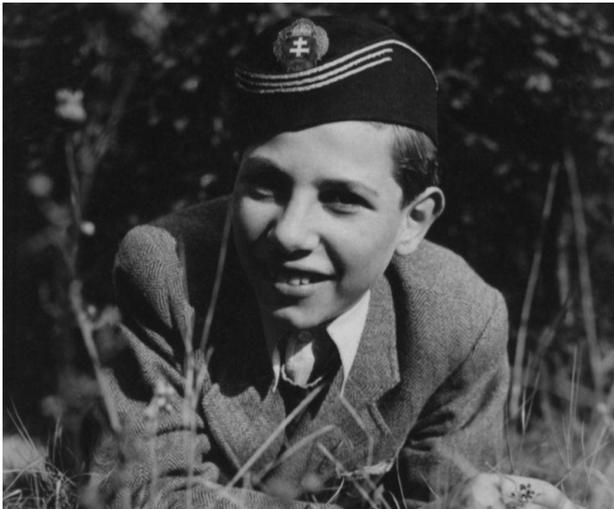
Писатель в детстве.

В 1977-м вышли повести Кертеса «Следопыт» и «Детективная история». В 1988-м он издает книгу «Фиаско», еще через два года появляется «Кадиш по нерожденному ребенку» — последняя книга в трилогии об одиссее Имре Кертеса. «Когда я начинаю думать о новом романе, — признавался он, — это всегда начинается с мысли об Освенциме... Начать жить заново нельзя. Я продолжаю жить той же самой своей обезжизненной жизнью». Протагонист книги — тот же персонаж, ставший мужем красавицы-еврейки, рожденной после войны и мечтающей о ребенке. В ответ женщина многократно слышит резкое «нет», мотивируемое страхом мужа иметь детей в мире, где возможен Холокост: «Никогда с другим ребенком не должно произойти то, что произошло со мной... А если он потом скажет: «Не хочу быть евреем?»»