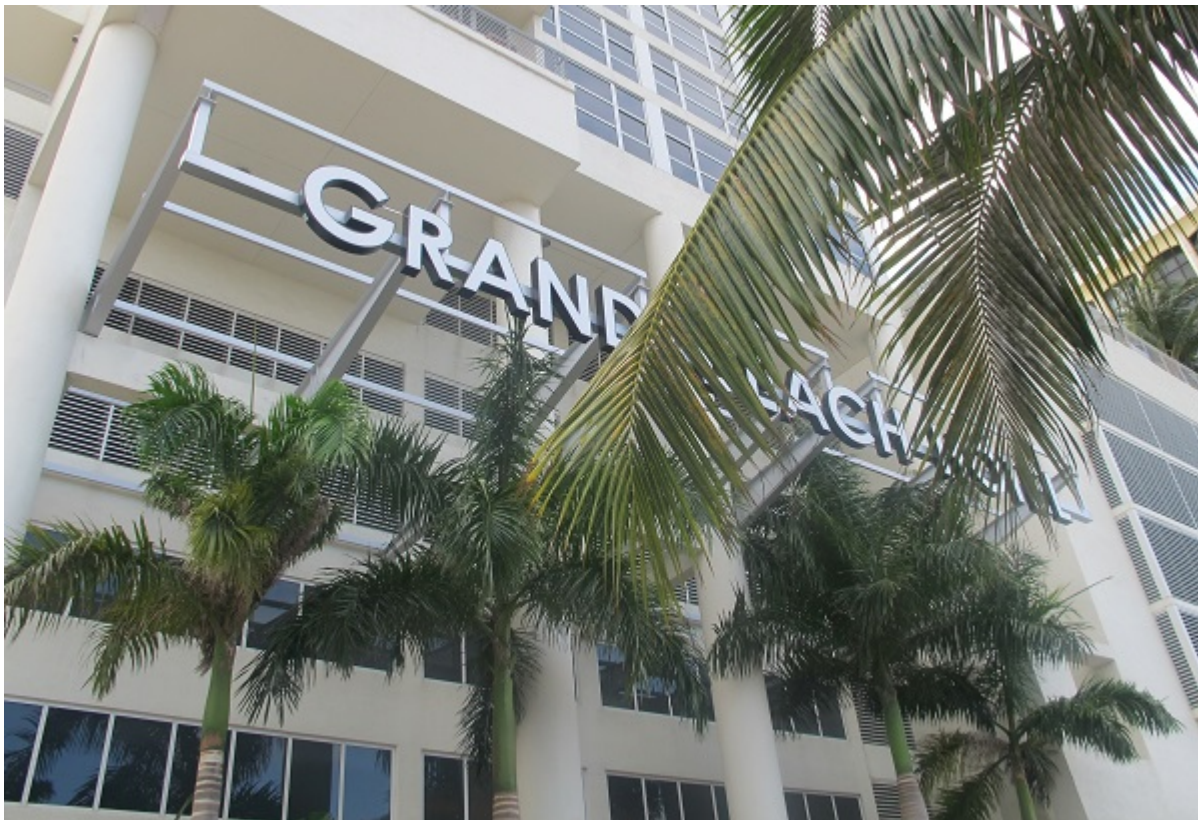
Grand Beach Hotel в Майями, принадлежащий компании Мюррея

После войны уже под именем Тони Мюррей молодой человек вернулся во Францию, где узнал, что отец погиб в Освенциме. Тони взял под контроль семейную строительную фирму, сколотил состояние, но позднее осел в Великобритании и получил британское гражданство.