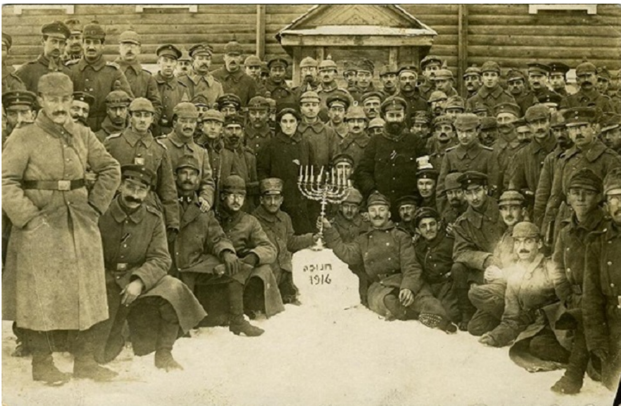
Германские солдаты-евреи празднуют Хануку, 1916

Миф о двойной лояльности евреев, разумеется, популярен не только в России. На нем базировалось дело Дрейфуса, в этом же грехе обвиняли уже немецких евреев в годы Первой мировой. Когда осенью 1917-го Россия практически вышла из войны, Германия немедленно начала переброску дивизий на западный фронт. О скорой победе в Берлине говорили почти открыто, даже несмотря на вступление в войну Соединенных Штатов. И вдруг, как гром с ясного неба, полное поражение германской армии... Тут же возникла теория о «предательском ударе в спину». Кем был нанесен этот удар? Всевозможными левыми, социалистами, республиканцами и, разумеется, евреями. Всем им, якобы германские национальные интересы были чужды. Историки единодушно и решительно опровергли эту теорию, но спустя несколько лет ее взяли на вооружение нацисты. Миф о двойной лояльности евреев так и оставался в арсенале режима до самого его конца.