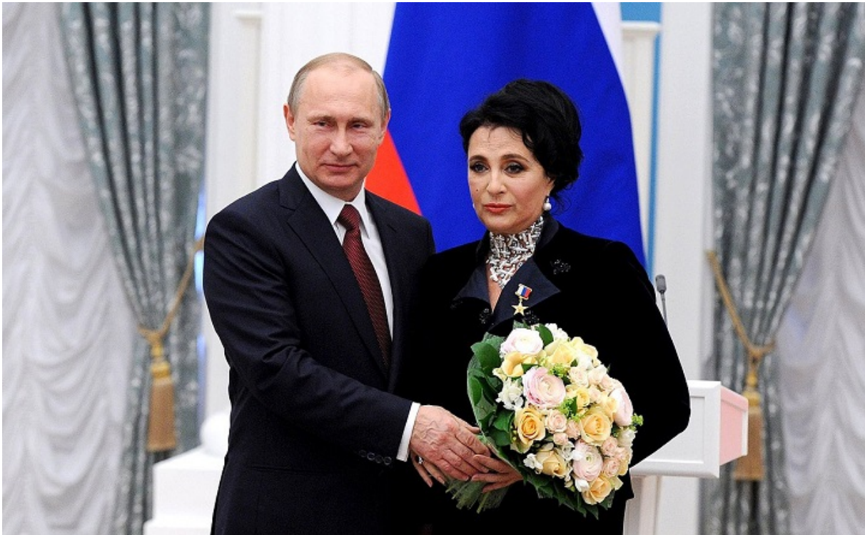
Церемония награждения Винер-Усмановой медалью «Герой Труда», 1 мая 2015 года

Да вот беда, золотой олимпийской медали Россию лишила израильтянка. В России это прекрасная почва для рассуждений о том, что Винер сидит на двух стульях, кушая русский хлеб, но в глубине души радуясь успехам своих братьев по крови. Подобное отношение к евреям возникло еще во времена Сталина и культивировалось все годы советской власти как элемент «борьбы с сионизмом». Поэтому у постсоветских евреев мысль о том, что их могут обвинить в двойной лояльности, сидит, что называется, в подкорке. Похоже, что это одна из причин столь высокой активности Усмановой-Винер в деле борьбы «за честь российской художественной гимнастики». Непременно надо доказать, что ты с нами, а не с ними.