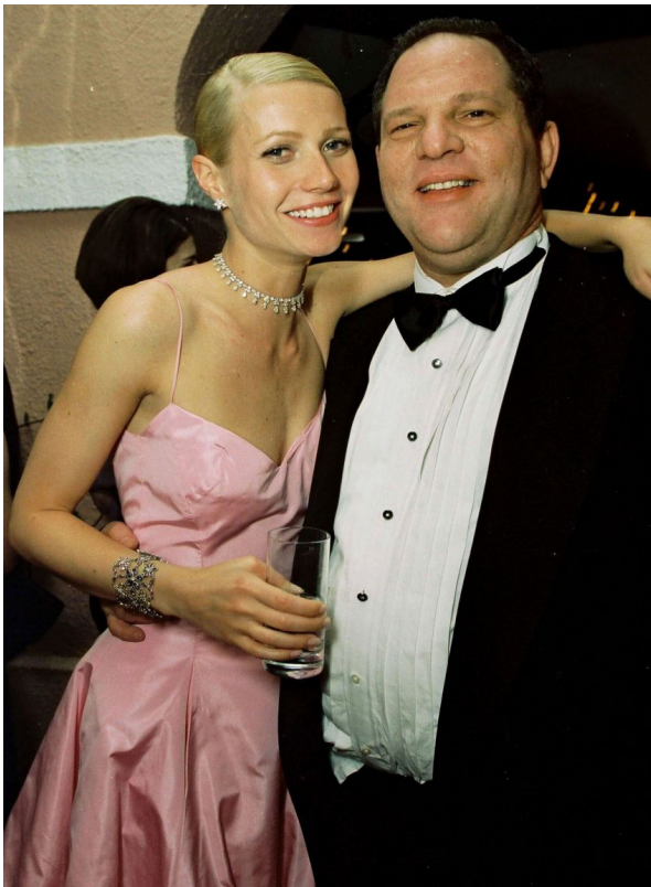
Харви Вайнштейн с Гвинет Пэлтроу