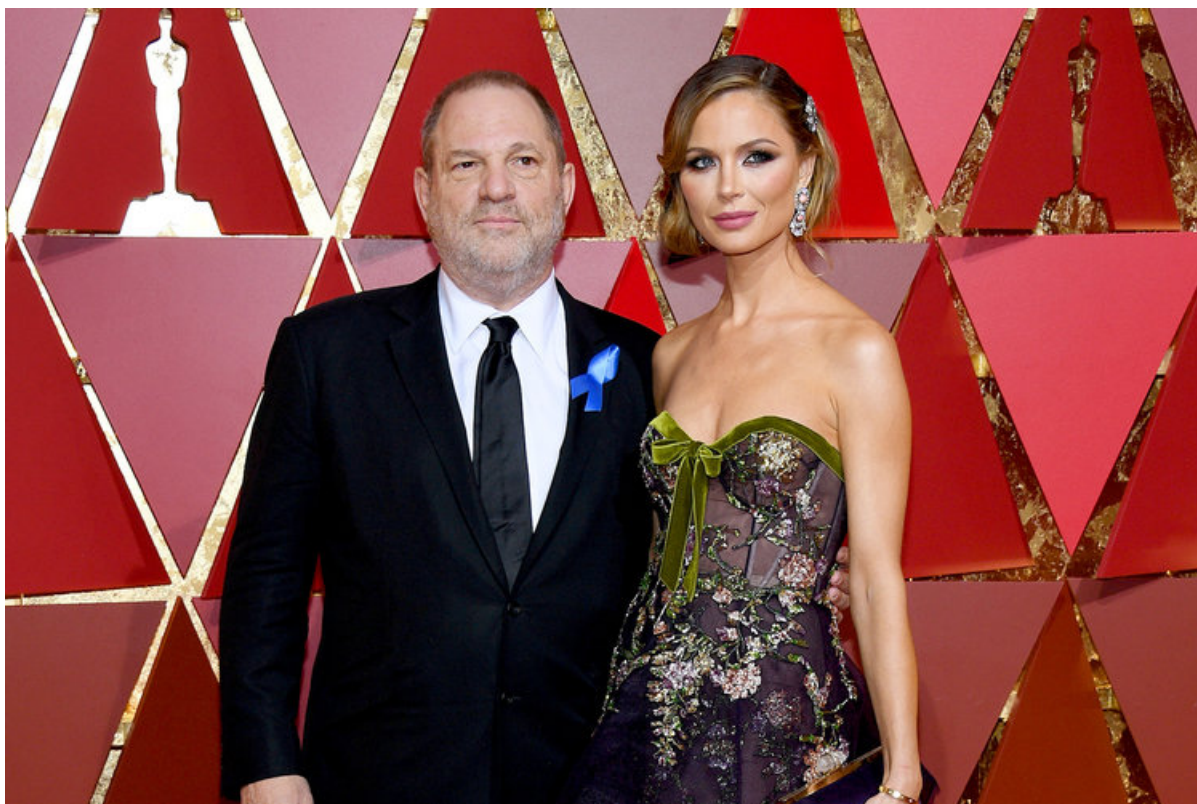
Харви с уже бывшей женой Джорджиной

вел себя уважительно, а также что она ничего не знала о его сексуальных домогательствах к другим женщинам. При этом актриса назвала приписываемое Вайнштейну поведение отвратительным и непростительным — но в целом не исключительным.