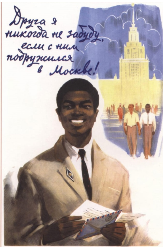
Советский плакат, 1964

Есть в русском фольклоре целый слой анекдотов об иностранцах в России, обыгрывающих разницу менталитетов. Вот мой фаворит. В ЦРУ подготовили высококвалифицированного шпиона, обучили его русскому языку и забросили в Россию. Вышел шпион из лесу, подошел к избушке, дай, говорит, бабушка, молока напиться.