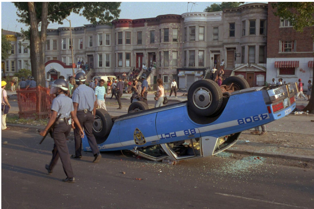
Расовые беспорядки в Краун-Хейтс, 1991

Как в плохом анекдоте, в статье появляется тот самый анекдотический иностранец, приехавший в Россию. Здесь это неназванный профессор, помогавший евреям уехать из СССР, человек, симпатизирующий русскоязычным евреям и любящий их обильно заправленные майонезом закуски. При этом лирический герой вопрошает автора: «Почему они такие расисты?». Все это очень похоже на перелицованный исторический анекдот про Вильгельма Гумбольдта. Этот немецкий просветитель сделал очень много для эмансипации евреев, а в конце жизни признался, что очень любит еврейский народ, но его конкретные представители такие сволочи. Тогда это было смешно, а сегодня является классическим примером антисемитизма.