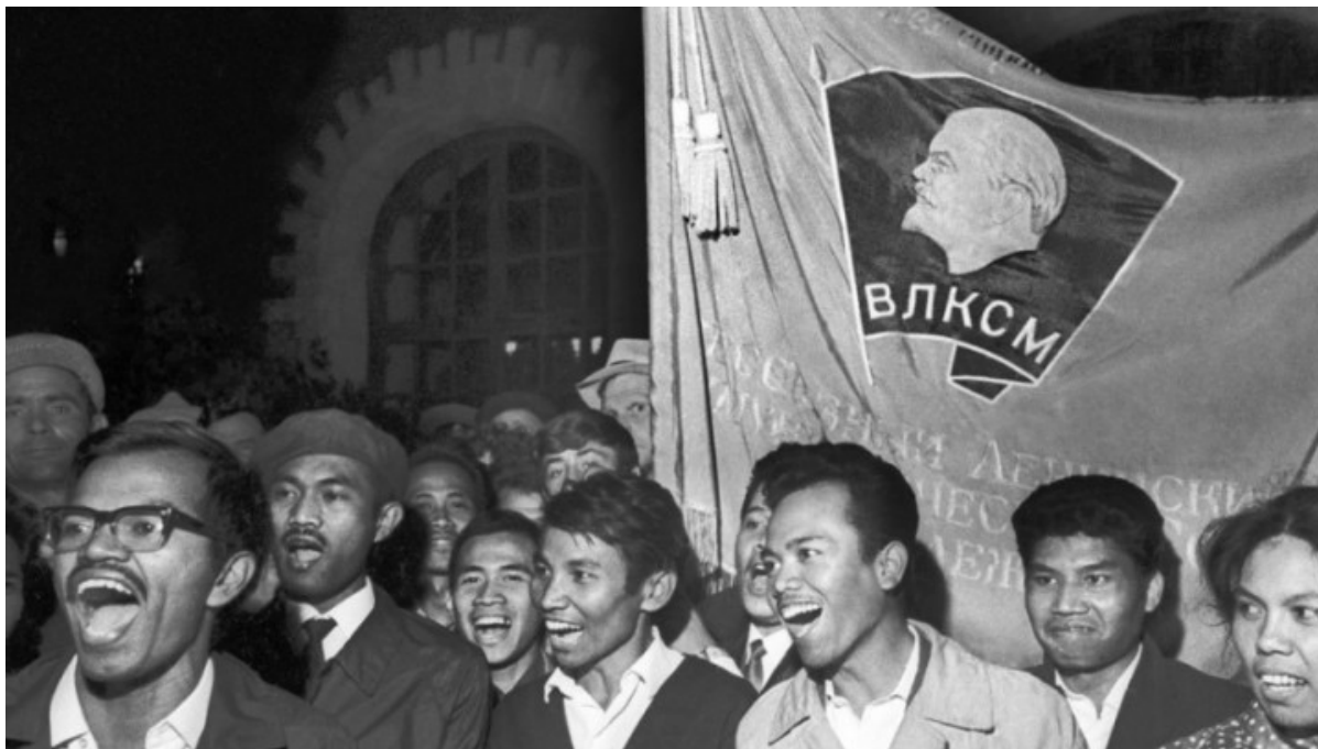
Иностранцы студенты на демонстрации

Во многом виной тому — культивирование жертвенности различных расово-гендерных групп. Обвинения в расизме стали одним из главных способов пропаганды. Усомнились в целесообразности зажима свободы слова в университетских кампусах — расисты. Протестуют против глобализации, уводящей за море рабочие места американцев, — расисты. Скептически относятся к бесконтрольной нелегальной иммиграции — расисты. Не устраивают либеральные политики идентичности — расисты.