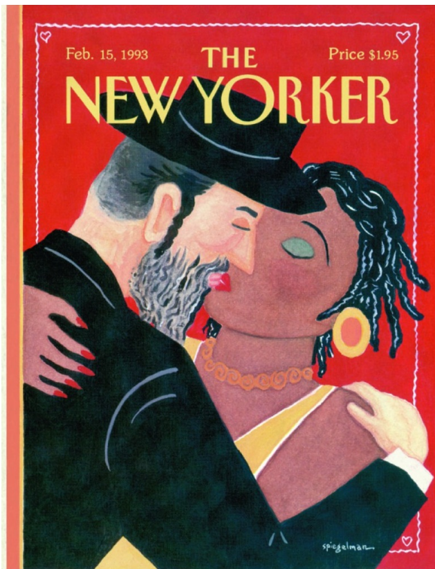
Обложка The New Yorker, февраль 1993