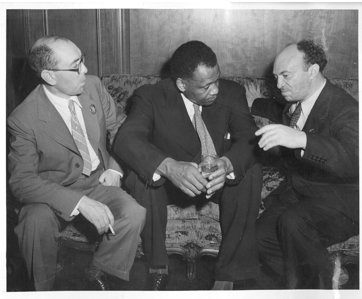
Ицик Фефер, Поль Робсон и Соломон Михоэлс, 1943

Недавно находящийся под контролем демократов горсовет Лос-Анджелеса «закрыл Америку» — отменил в городе празднование Дня Колумба. Вместо него теперь будет «День коренных жителей». От протестов итало-американцев, считающих День Колумба признанием вклада их общины в строительство Америки, отмахнулись привычным обвинением в расизме.