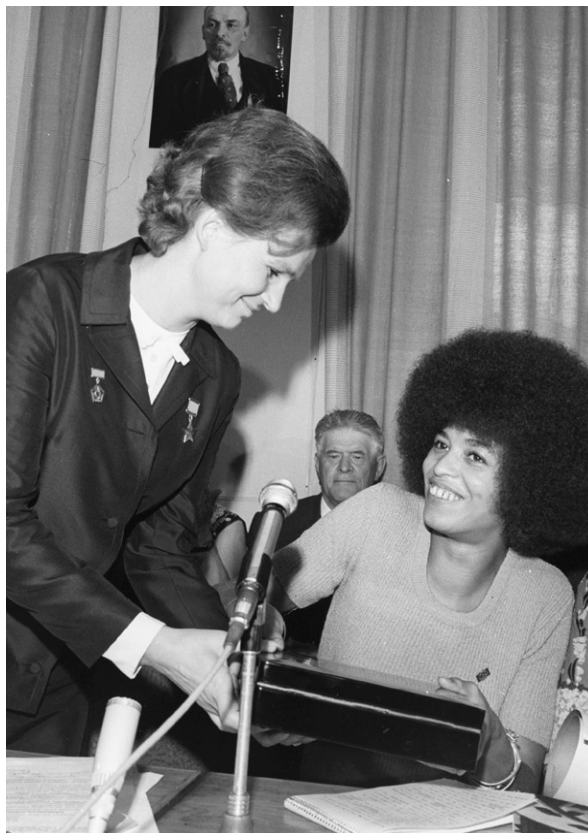
Анджела Дэвис с Валентиной Терешковой

Автор не приводит ссылок на исследования и архивы, которые цитирует. Но мне и не нужны архивы, чтобы оценить масштаб враждебности к «цветным» в СССР. У нас во Львовском мединституте целый корпус общежития был отведен для африканских и латиноамериканских студентов. Я часто ходил