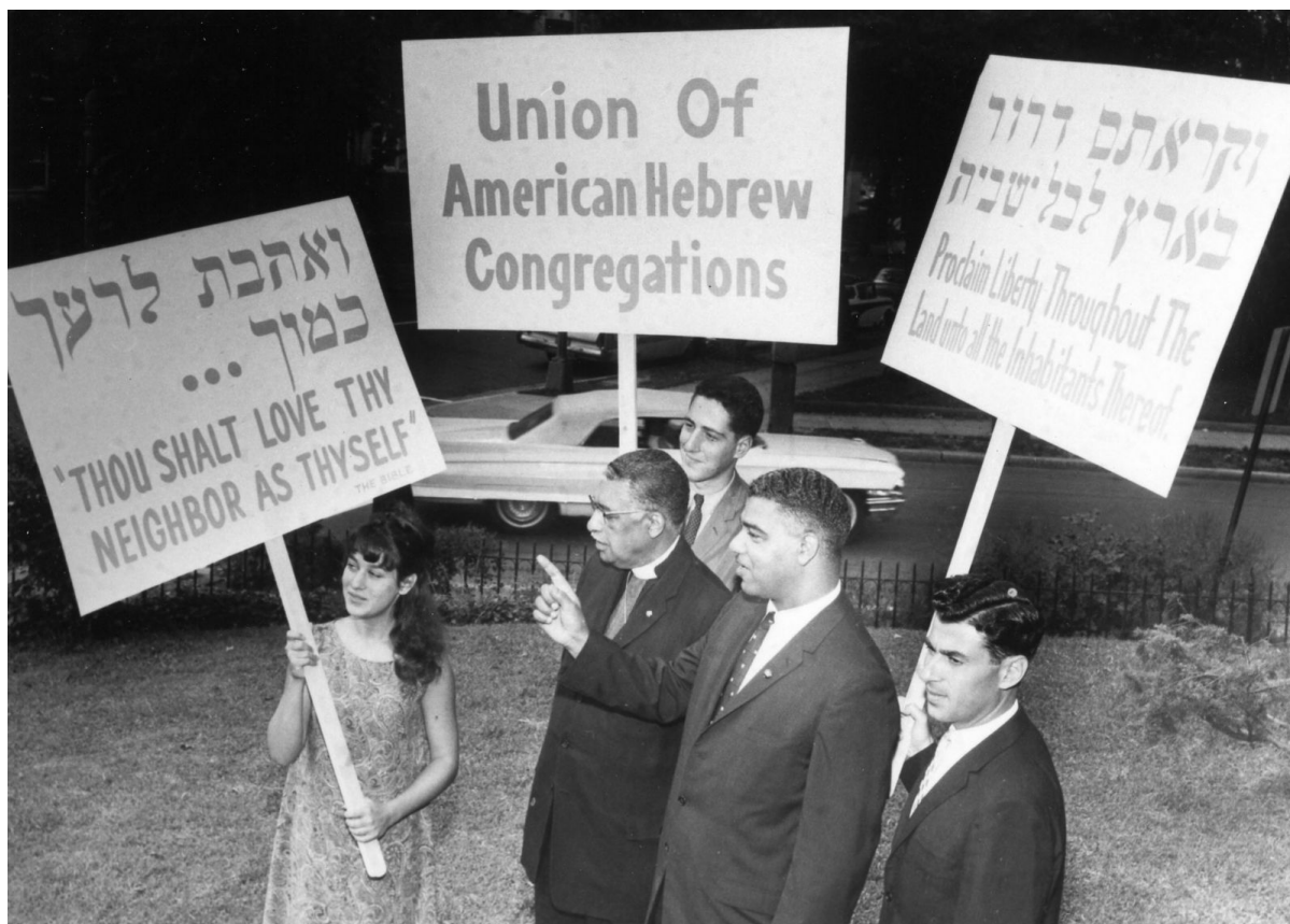
Еврейские и афроамериканские активисты на демонстрации в защиту гражданских прав

Мои впечатления подтверждают и ежегодные отчеты Антидиффамационной лиги, фиксирующие куда более высокий уровень антисемитизма среди расовых меньшинств, чем среди белых американцев. Видный либеральный деятель, сторонник и близкий друг четы Клинтонов профессор Алан Дершовиц даже назвал интерсекционализм синонимом антисемитизма.