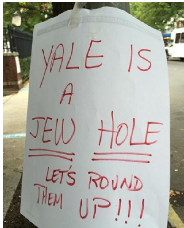
На плакате: «Йель полон евреев. Устроим им облаву!!!»

Причина не только в евреях, но и в переменах в Лиге плюща. В Пенсильванском университете процент белых студентов в целом снизился с 64% до 44%. И это реальность, которая ставит новые вопросы перед евреями: ведь в Лиге плюща они за несколько десятилетий превратились из гонимых чужаков в часть истеблишмента. Как «новых евреев» сегодня часто