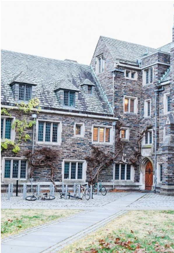
Обвитый плющом корпус Принстонского университета

Когда еврейская община утвердилась в Америке как богатая, успешная, высокообразованная группа, Лига плюща стала уже не столько символом высокого статуса в обществе (каковым она была для иммигрантов в первом и втором поколениях), сколько полем сражения в политике идентичности. Иначе говоря, обострение конкуренции за места в Лиге плюща повлекло за собой уменьшение числа студентов-евреев, но в то же самое время распахнуло двери этих университетов перед другими группами. Не стоит думать, будто от школьников-евреев сегодня требуют поступить в лучшие университеты менее настойчиво, чем от их родителей когда-то; но им стало труднее, чем их родителям, туда поступить.