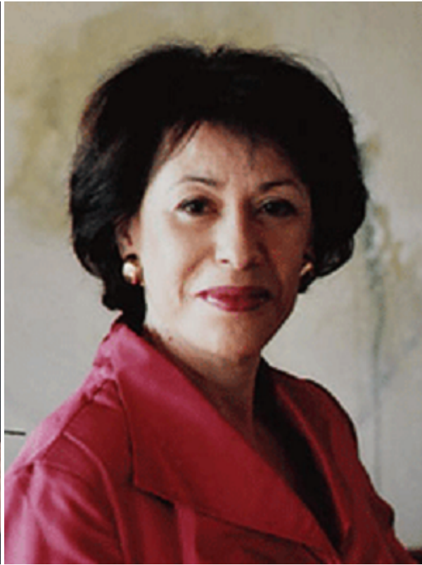
Профессор Стивен Гринблатт