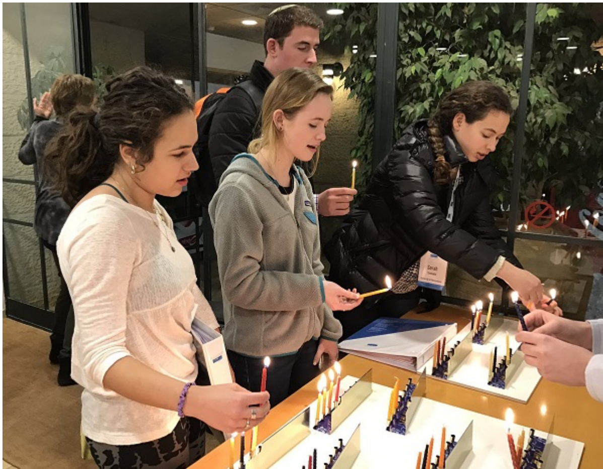
Зажигание ханукальных свечей в Пенсильванском университете

В 2010 году доля евреев в Пенсильванском университете составляла около 20%, к 2016-му она упала до 13%. В 2000 — 2010 годах примерно 20% первокурсников Йельского университета называли себя евреями, сегодня таких — 16%. Если недавно 10% первокурсников Гарварда причисляли себя к евреям, среди тех, кто окончит университет в 2020-м, таких будет всего 6%.